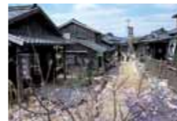
二十四の瞳映画村 営業時間/9:00~17:00 (ホテルよりお車で約40分)