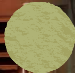
オリーブ宴会場前通路

〈泉 質〉カルシウム・ナトリウム・塩化物温泉 〈効 能〉神経痛、筋肉痛、関節炎、慢性消化器病、痔症、五十肩、運動麻痺、冷え性、疲労回復など 〈特 徴〉湯船から見る瀬戸内海の景色と夜の星空の美しさはお客様よりたいへんご好評をいただいております。