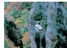
寒霞溪ロープウェイ 営業時間/8:00~17:00 (ホテルよりお車で約40分)