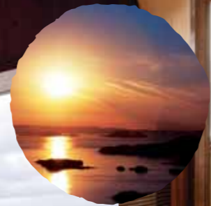
EXECUTIVE ROOM 604・605

朝の光にきらめく水面、静かにささやく潮の声。 海風や天空と一体になりながら極上の湯につかる時、 カラダは芯まで癒され、心はやさしさに目覚めていく。 それは、大きな自然の流れと 素のままの自分と出会える、 真の贅沢な空間。