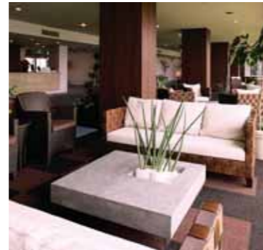
フロント・ロビー