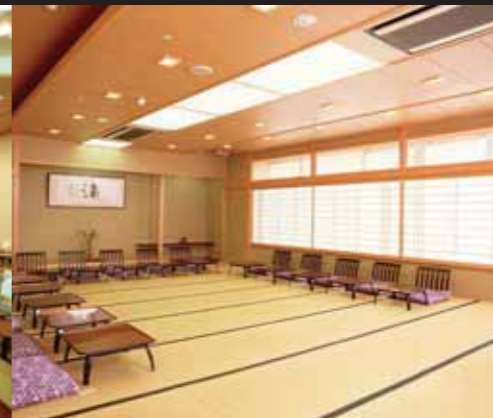
2F 中・小宴会場(9部屋)