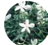
ジャスミン (4月下旬~12月上旬)