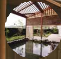
露天風呂「浜風の湯」