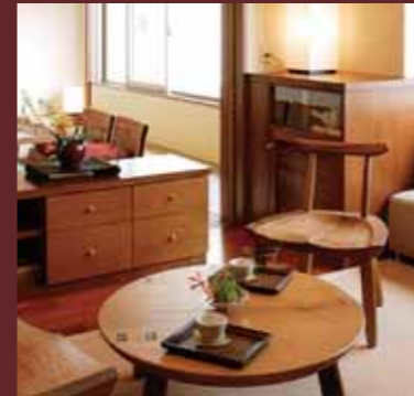
EXECUTIVE ROOM 601

表情の違う部屋が、旅の印象を一段と引き立てます。 6階のエグゼクティブルームは、各部屋それぞれデザインを変えたスタイルでコーディネート。 いずれも、光、風、緑を随所に取り入れ、異空間への旅を満喫していただける空間です。 小豆島国際ホテルならではのリゾートスタイルは、きっとあなたの心とカラダをじっくりと癒します。