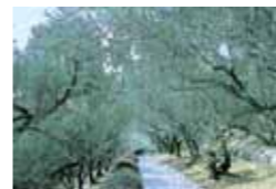
オリーブ園 営業時間/8:30~17:00 (ホテルよりお車で約20分)