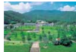
道の駅 小豆島オリーブ公園 営業時間/8:30~17:00 (ホテルよりお車で約20分)