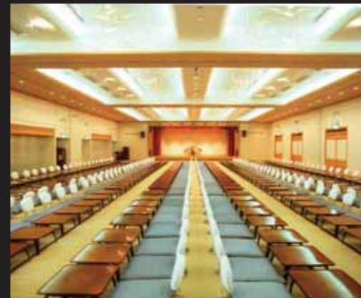
1F 大宴会場「オリーブの間」