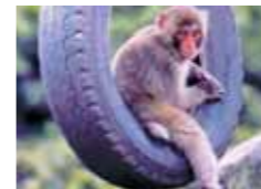
銚子溪お猿の国 営業時間/8:10~16:50 (ホテルよりお車で約15分)