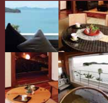
EXECUTIVE ROOM 602