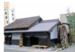
京宝亭 営業時間/8:30~17:00 (ホテルよりお車で約30分)