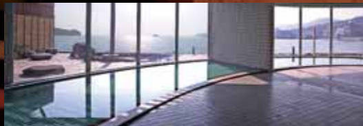
大浴場「オリーブの湯」

たそがれから夜景へと変わりゆく海辺の露天。 湯けむりの向こうに広がる潮風の音。 質のいい柔らかな湯に包まれて心をほっと温める。 そこには、何事にもとらわれない、 ゆるやかな空気が流れている。