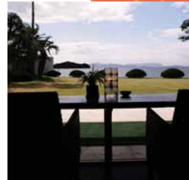
カフェ[ニース]より瀬戸内を望む