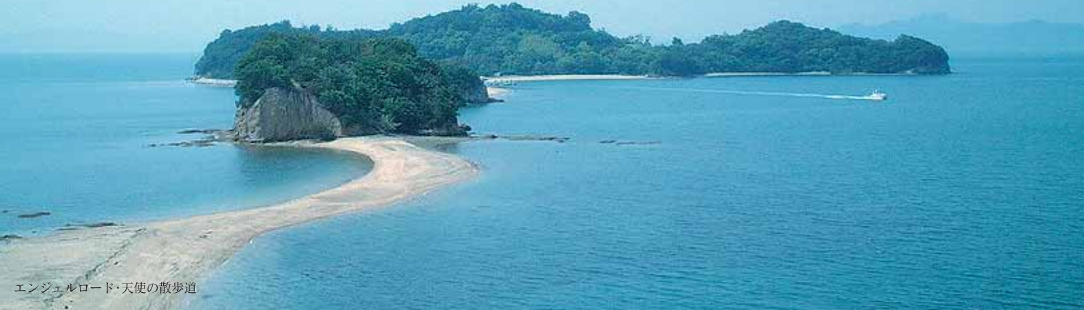
エンジェルロード・天使の散歩道

目の前に広がるのは、海の青と空の青。 チェックインだけではなく、 ロビーに佇むひとときを、優雅に過ごす豊かさ。 ソファに座り、そっと目を閉じれば、 風を聞き、波を感じる五感が、不思議なほど冴え渡っていく。